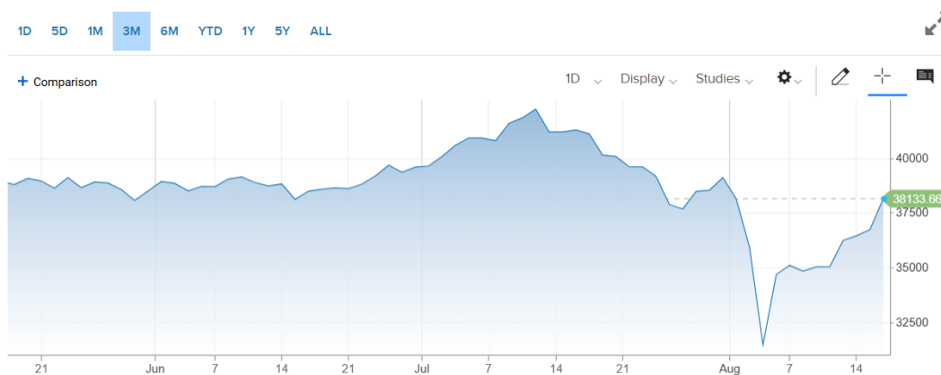
Evolutie Nikkei – cnbc.com

Scaderea de la inceputul lunii pare acum mai degraba un episod de volatilitate inalta. Mare parte din ea a fost recuperata, pietele creionand in ultimele sedinte un drum spre normalizare. Graficele pe trei luni (15 mai - 15 august 2024) ale pietelor din Japonia, SUA si Romania sunt graitoare in privinta trendului general, a amplitudinii scaderii dar si a recuperarii ulterioare.